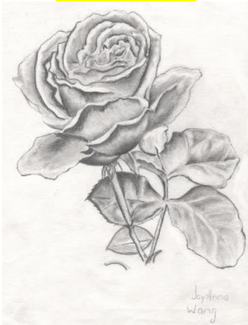
三甲王新洁素描作品 "玫瑰花" 3A Joy Anna Wang Pencil Drawing "Roses"