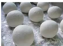
tāng yuán 湯 圓

yuán xiāo huó dòng zhǔ yào yǒu chī yuán xiāo , cāi 元 宵 活 動 ， 主 要 有 吃 元 宵 、 猜 dēng mí , fàng tiān dēng děng qǐng wèn yuán xiāo 燈 謎 、 放 天 燈 等 。 請 問 ， 元 宵 jiē de dài biǎo shí wù shì : 節 的 代 表 食 物 是 :