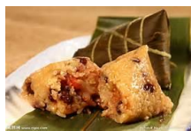
zòng zǐ 粽 子