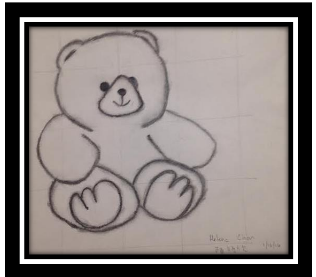
BL6A 陳 恆 欣

méi shān wén huà kè sù miào zuò pǐn - "tài dí xióng" 梅 山 文 化 課 素 描 作 品 - "泰 迪 熊"