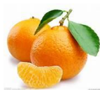
jú zǐ 橘 子