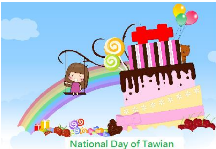
National Day of Taiwan

kuài kuài lè lè shàng xué píng píng ān ān huí jiā 快 快 樂 樂 上 學 平 平 安 安 回 家