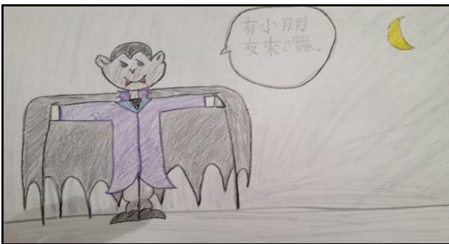
yǒu xiǎo péng yǒu lái lā Dracula: 有 小 朋 友 來 囉