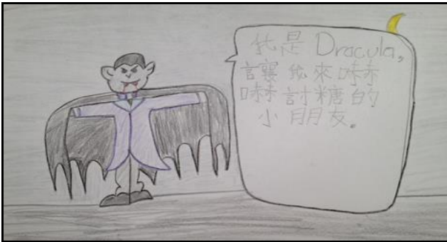
wǒ shì Dracula, ràng wǒ lái xià xià tǎo Dracula: 我 是 Dracula, 讓 是 我 來 嚇 嚇 討 糖 táng de xiǎo péng yǒu 糖 的 小 朋 友 友