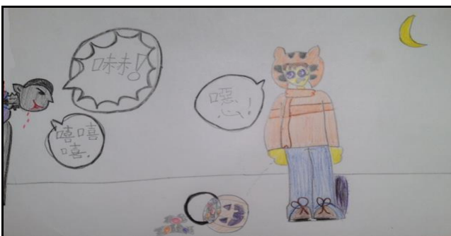
xià, xī xī xī è Dracula: 嚇 嚇 , 嘻 嘻 嘻 嘻 Trick-or-treater: 噫 噫