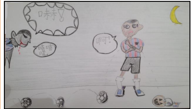
xià, xī xī xī ā Dracula: 嚇 嚇 , 嘻 嘻 嘻 嘻 Trick-or-treater: 啊 啊