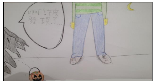
ā! bèi fā xiàn le Dracula: 啊 啊 ! 被 發 現 了